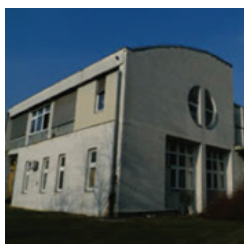
JABUKOVAC 10, ZAGREB Nastavnički odsjek