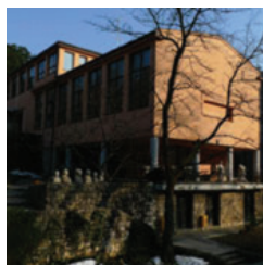
ZAMENHOFOVA 14, ZAGREB Odsjek za konzerviranje i restauriranje umjetnina