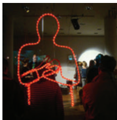
ODSJEK ZA ANIMIRANI FILM I NOVE MEDIJE