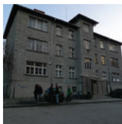
ZAGORSKA 16, ZAGREB Odsjek za animirani film i nove medije