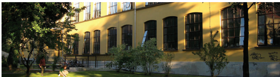
ILICA 85, ZAGREB / Slikarski, Grafički i Kiparski odsjek