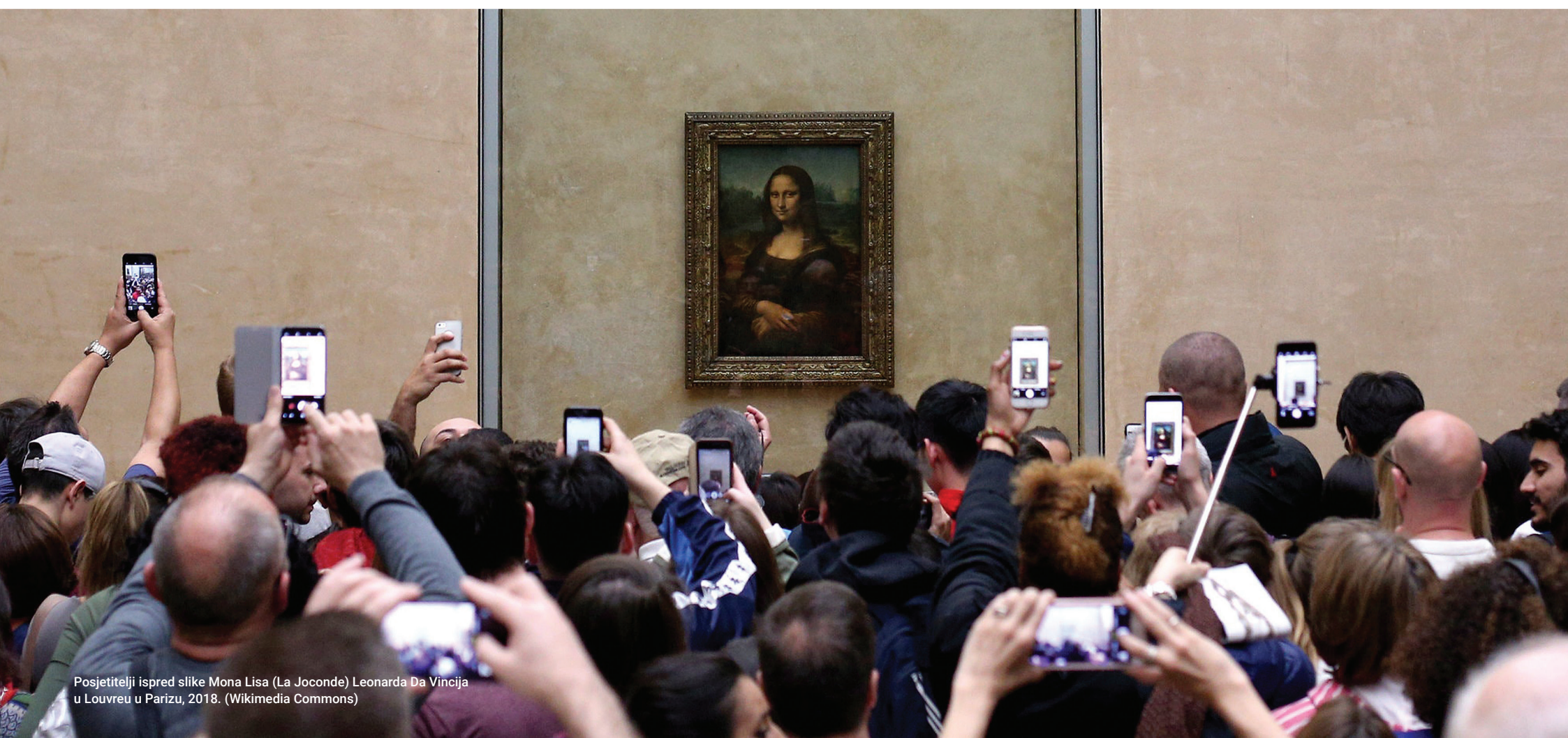
Posjetitelji ispred slike Mona Lisa (La Joconde) Leonarda Da Vincija u Louvreu u Parizu, 2018.