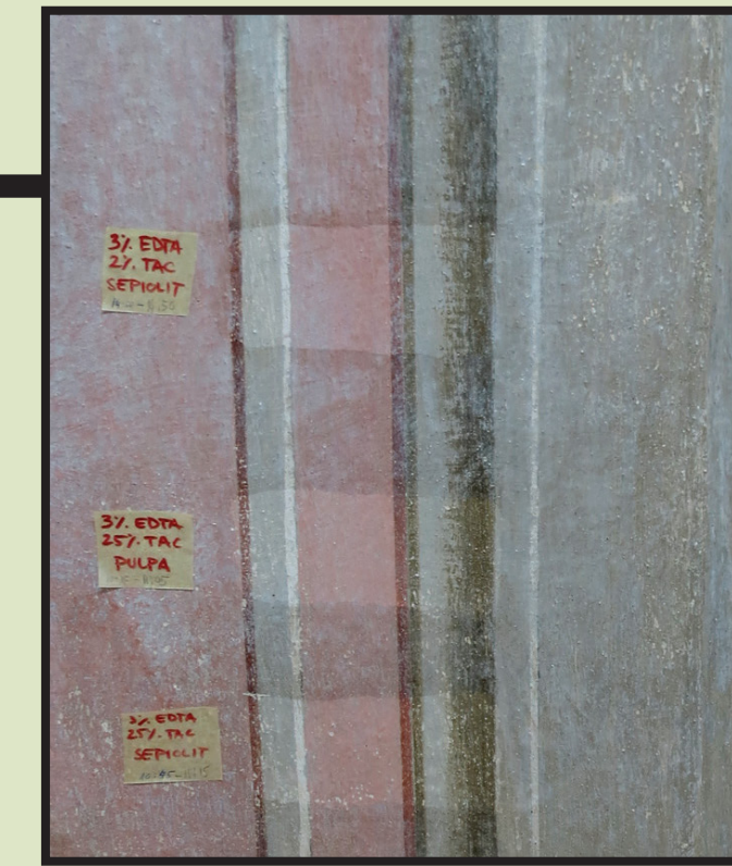
Slika 1. Probe uklanjanja preslika raznim kemijskim sredstvima

Tijekom četiri dana boravka u objektu studentice OKIRU sudjelovale su u mehaničkom i kemijskom čišćenju oslika. Prethodno su upoznate sa metodologijom pojedinog postupka čišćenja koju je iznimno važno poštivati kako bi se postigli optimalni rezultati.