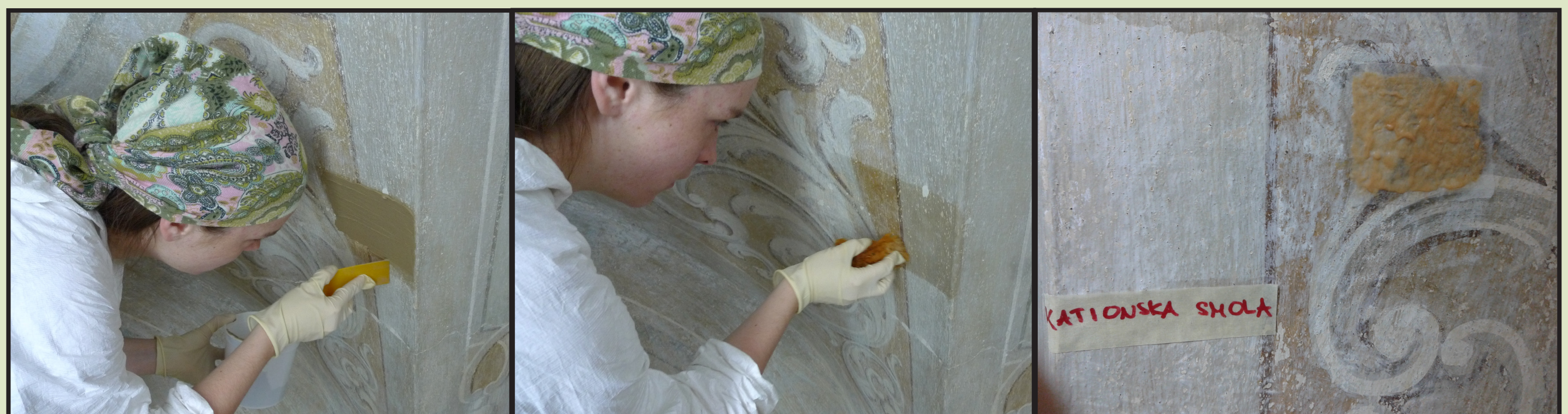
Slika 5. Dočišćavanje naliča; mješavina 2% EDTA + 6% TAC + sepiolit te kationski izmjenjivač (smola)