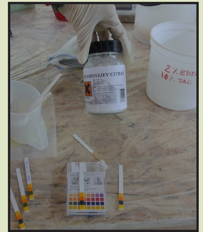
Slika 2. Ispitivanje pH upotrebljenih kemijskih sredstava