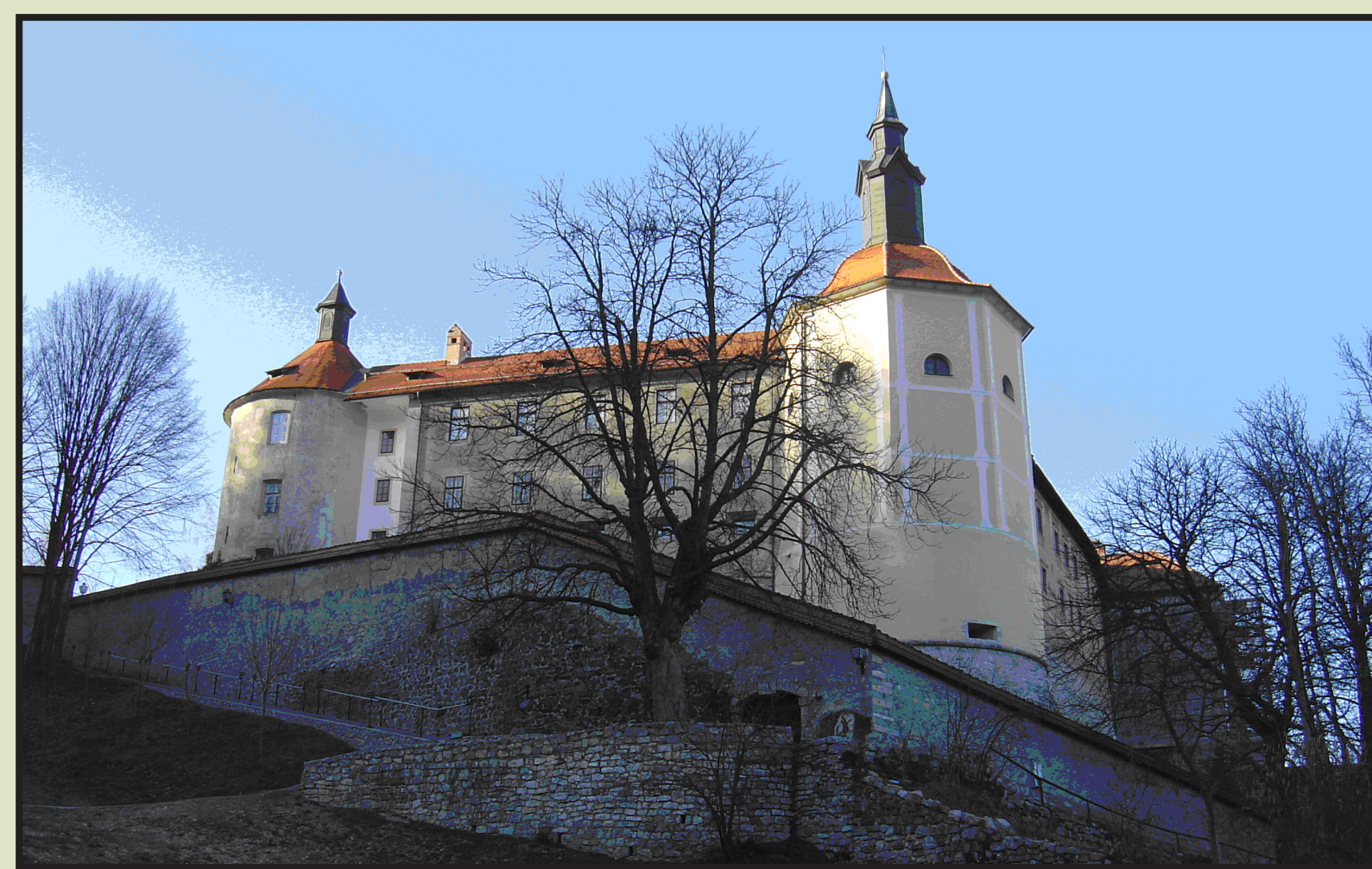
Slika 3. Loški grad, Škofja Loka