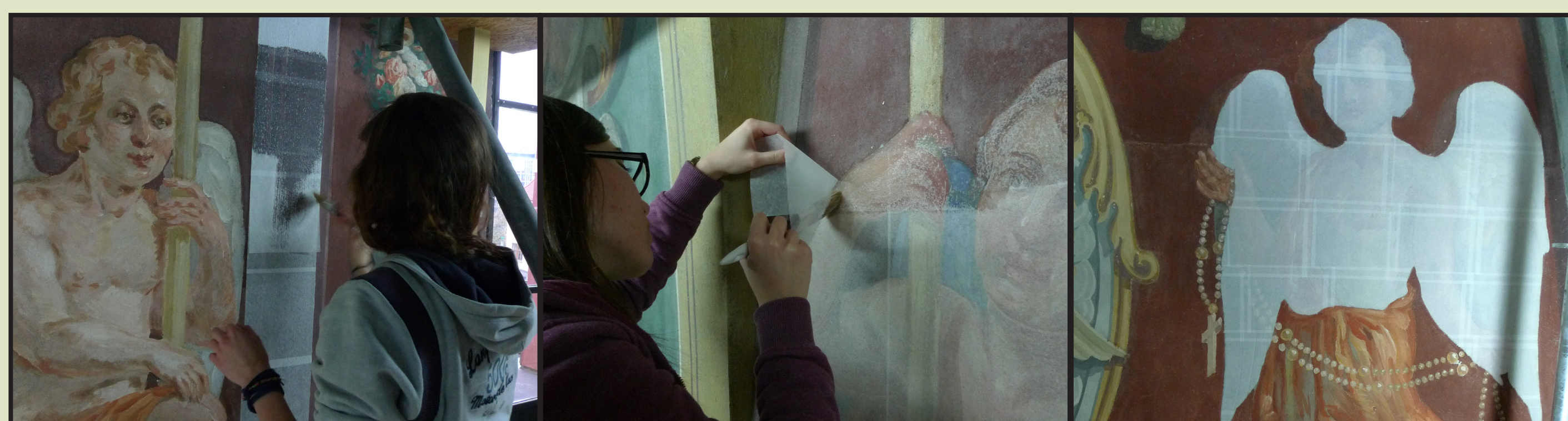
Slika 8. Polaganje japanskog papira prije aplikacije obloga od amonijevog karbonata