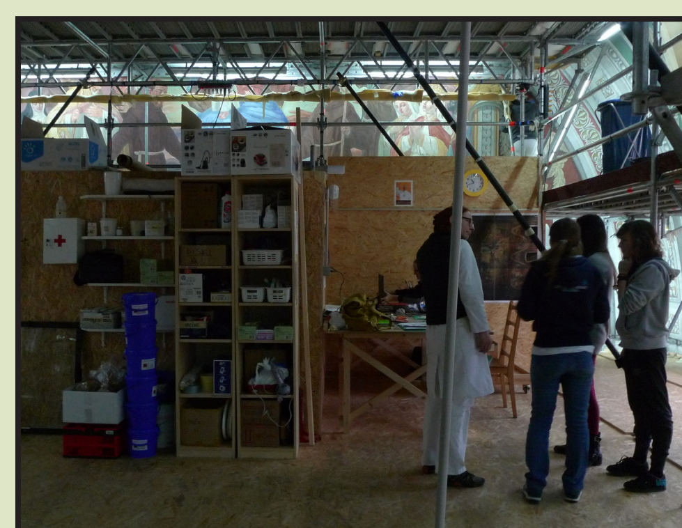
Slika 7. Radni prostor - skela u svetištu

Tijekom jednodnevnog boravka u crkvi studenticama OKIRU omogućen je rad na zidnim slikama, uz stručno i srdačno vodstvo kolega konzervatora-restauratora. Zidne slike zahvaćene sulfatizacijom te prekrivene talogom prašine i čađe već se nekoliko mjeseci desaliniziraju i čiste oblozima s 10%-tnom otopinom amonijevog karbonata, uz iznimno uspješne rezultate. Metodologija je pomno objašnjena i demonstrirana studenticama koje su potom same izvele dio postupka; nanošenje japanskog papira otopinom Tylose i kidanje japanskog papira prema formama, kao priprema za nanošenje pulpe.