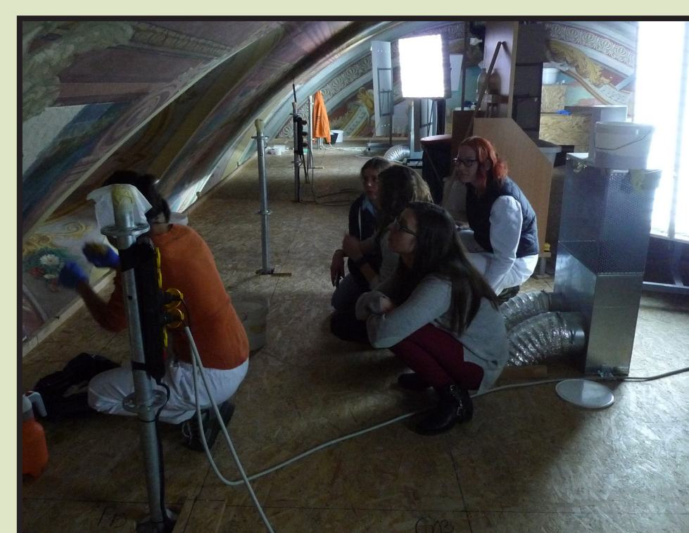
Slika 9. i 10. Demonstracija uklanjanja obloga od amonijevog karbonata i ispiranja zida