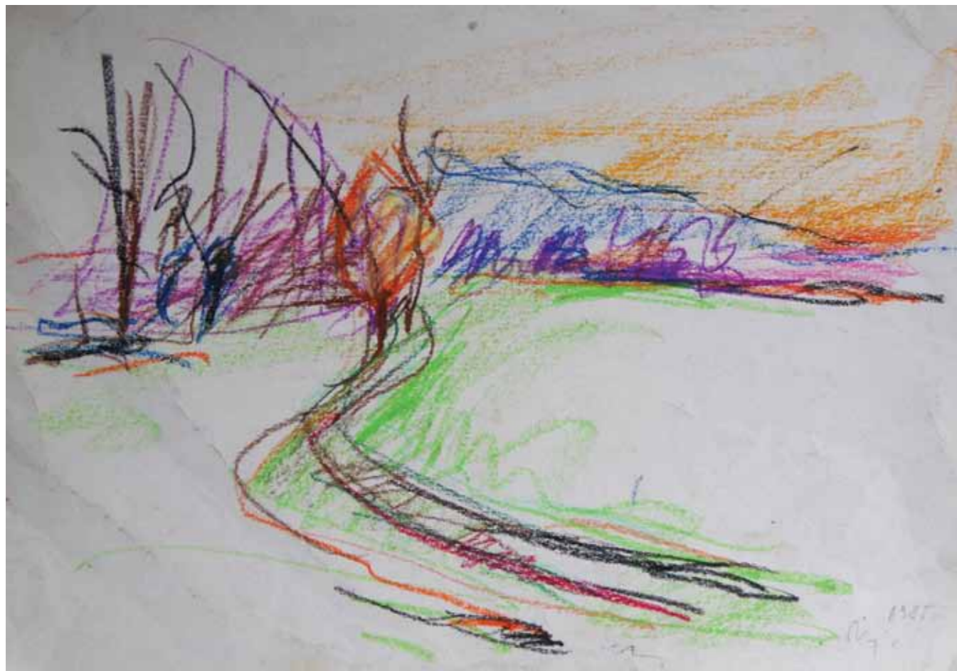
Zlatarsko polje, 29 x 41 cm, 1985.