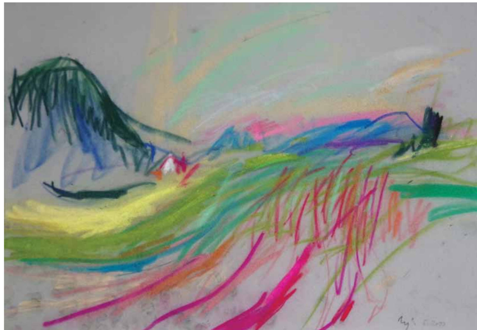
Motiv iz Zajezde, 35 x 50 cm, 2017.

Izloženi radovi nastali su u razdoblju od sredine 80-ih godina XX. stoljeća do danas, u tehnikama uljnog i suhog pastela, u plein airu oko Zlatara, podno Ivančice.