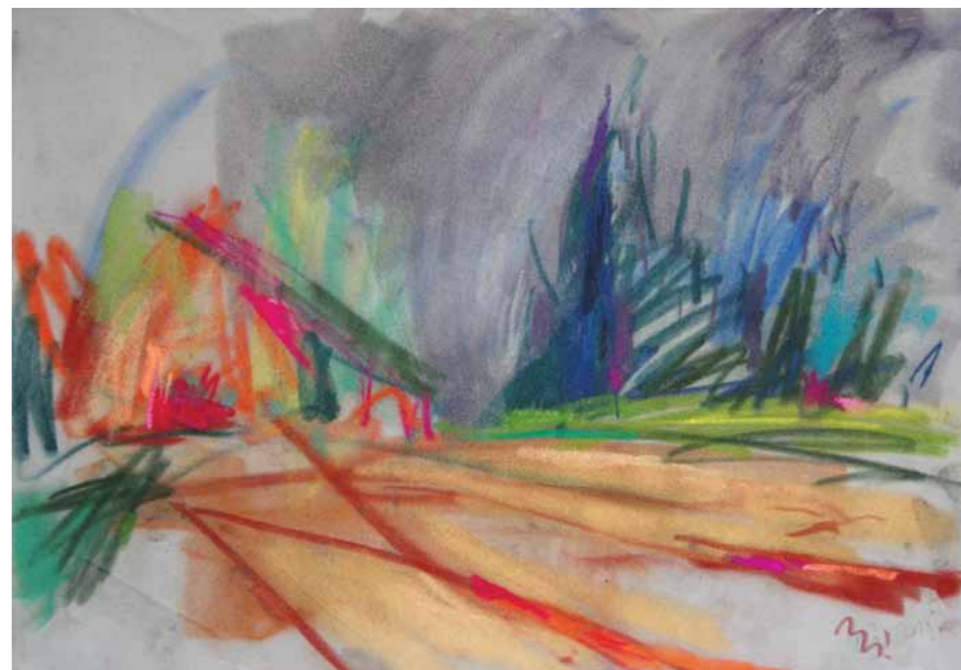
Selo Biškupi , 35 x 50 cm, 2019.

U Šikadu , 35 x 50 cm, 2016. / na prethodnoj stranici /