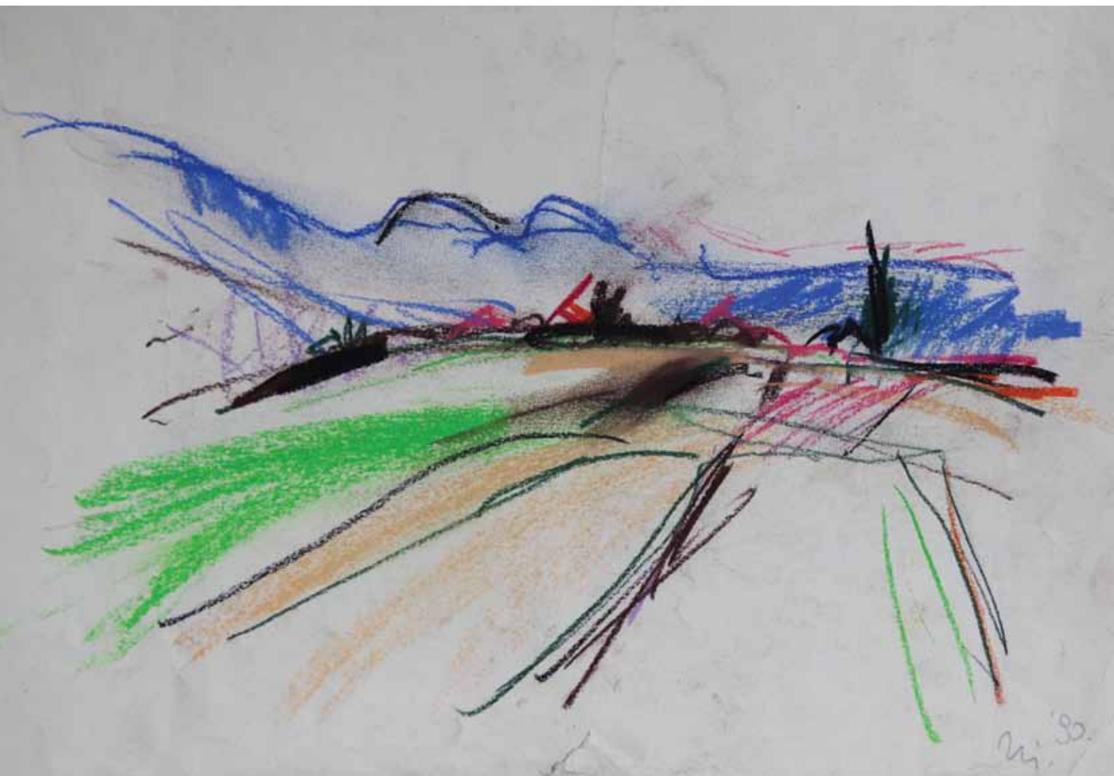
Pogled prema Belcu, 29 x 40, 1990.

PUČKO OTVORENO UČILIŠTE KRAPINA GALERIJA GRADA KRAPINE MAGISTRATSKA 25