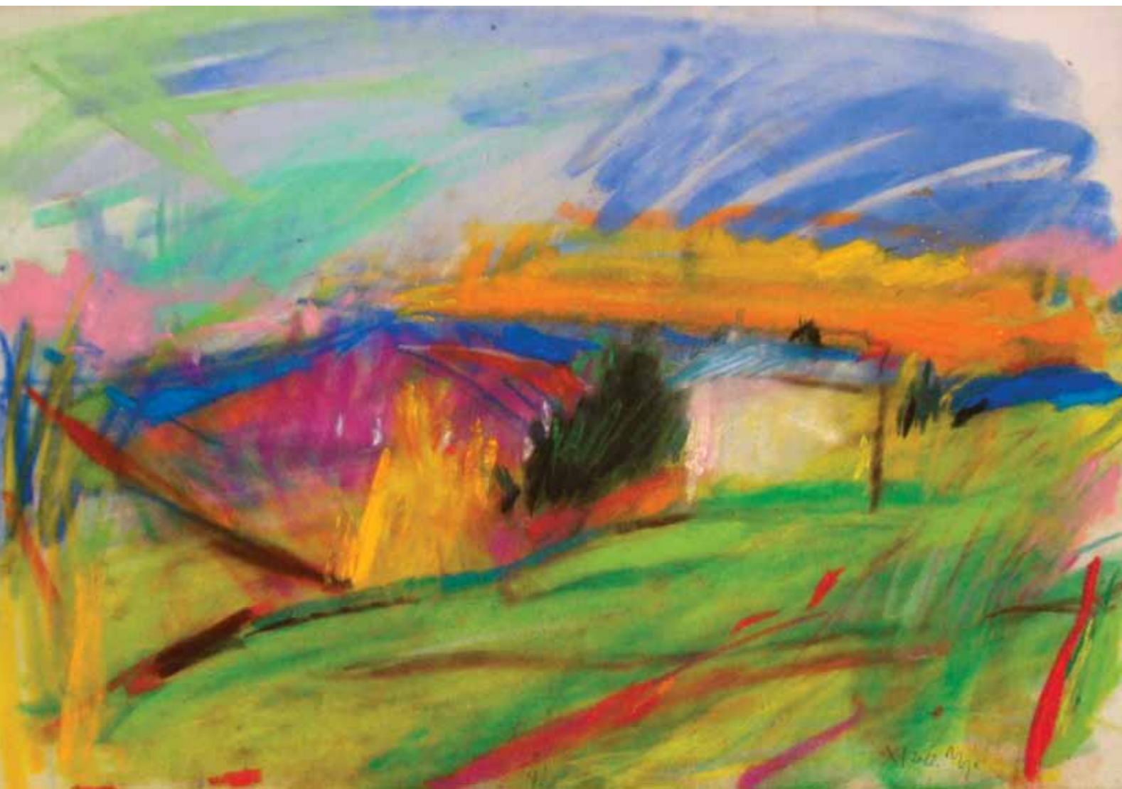
Klet u Vugradcu, 35 x 50 cm, 2014.