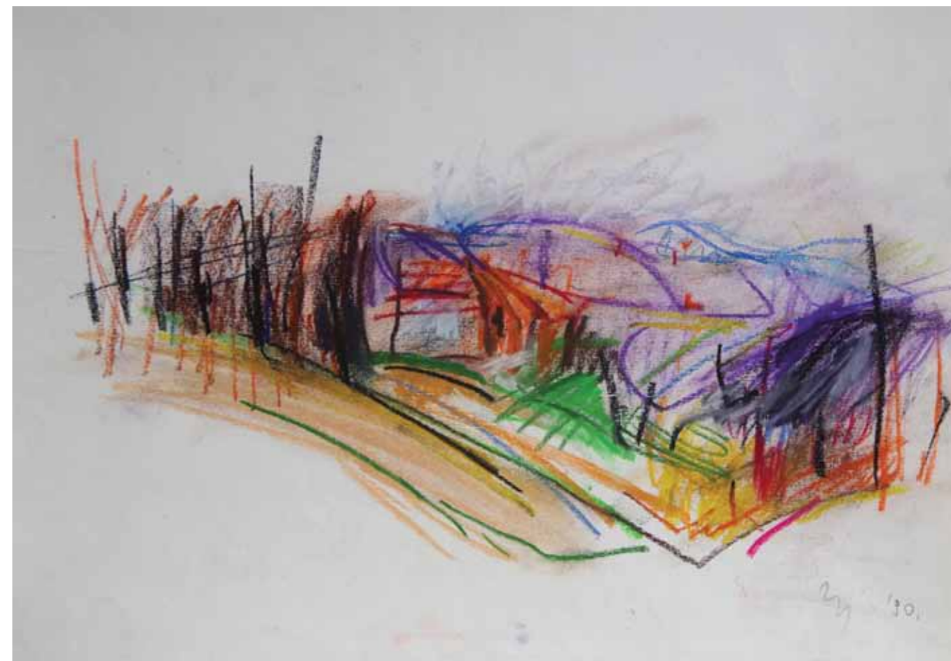
Zagorski krajolik, 29 x 40 cm, 1990.