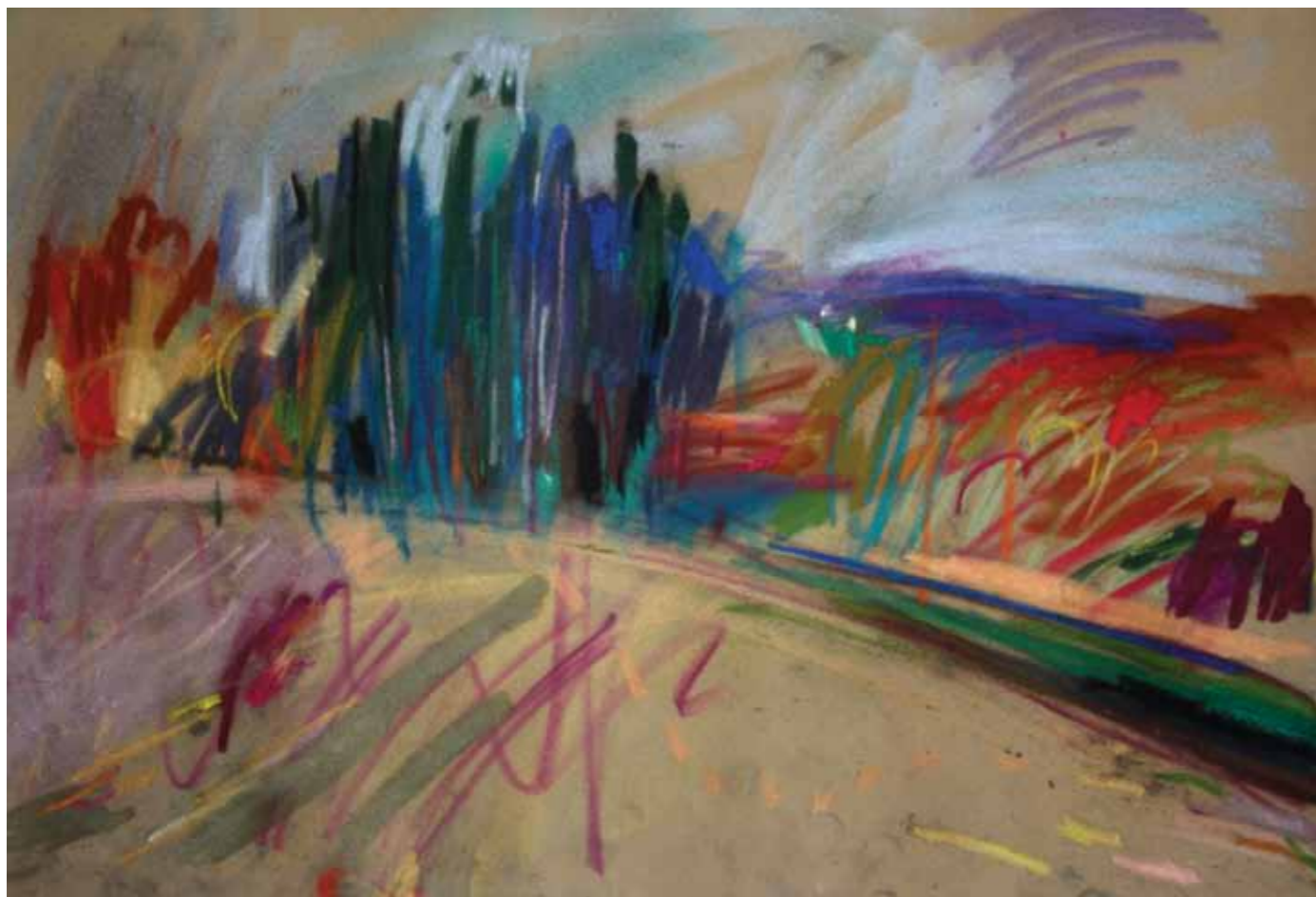
U Šikadu 2 , 35 x 50 cm, 2016.

U Šikadu , 35 x 50 cm, 2016. / na prethodnoj stranici /